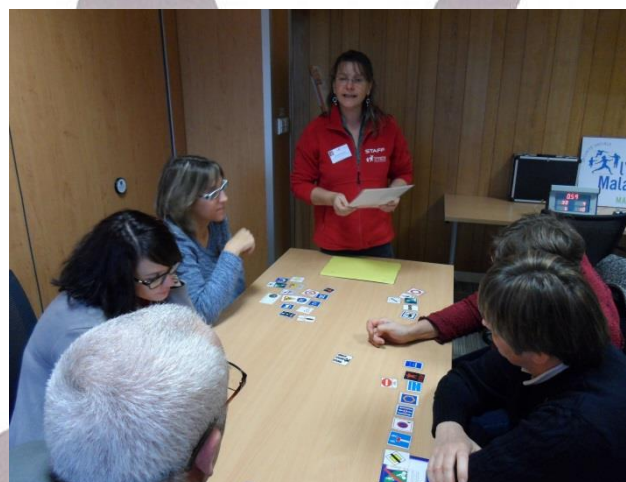
Atelier d'informations sur les panneaux