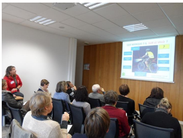
Session du code de la route